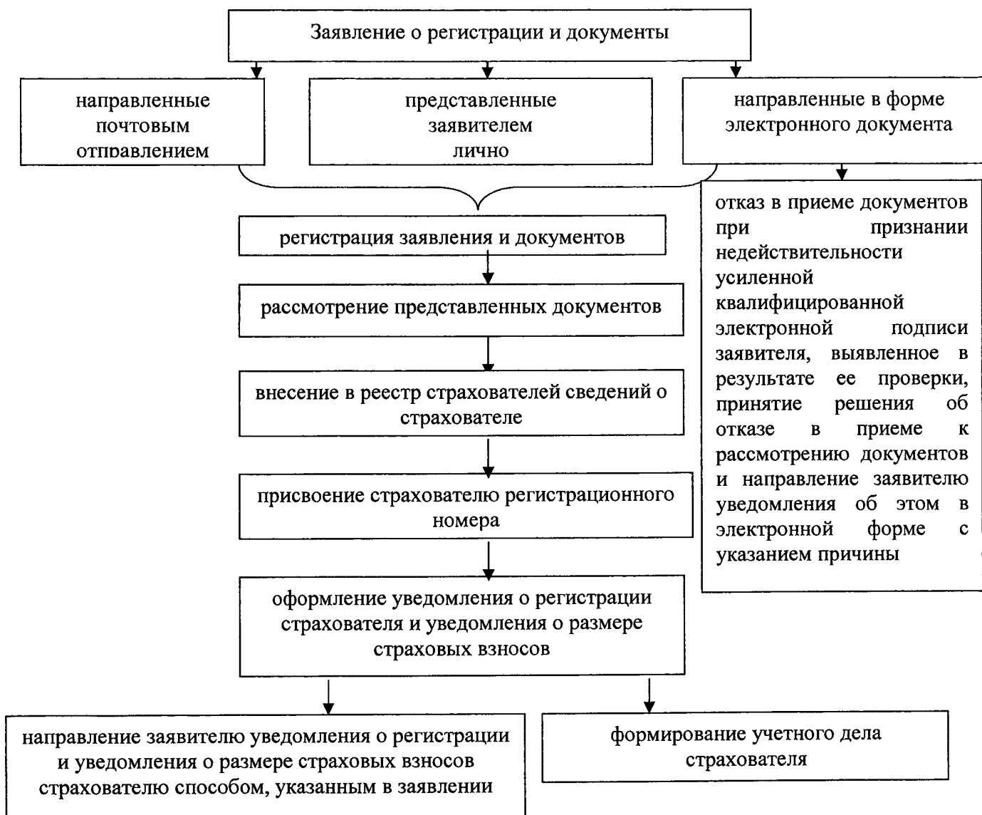
Блок-схема последовательности действий территориального органа Фонда социального страхования Российской Федерации по регистрации в качестве страхователей