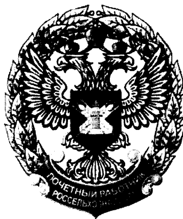
Рисунок нагрудного знака "Почетный работник Россельхознадзора"

Знак имеет миниатюрную копию высотой 20 мм и шириной 15 мм.