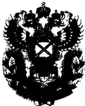
РИСУНОК нагрудного знака «Почетный работник антимонопольных органов России»

На оборотной стороне знака имеется приспособление для крепления к одежде.