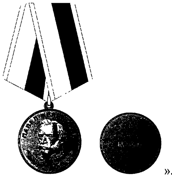
РИСУНОК медали Павла Мельникова

11) приложение № 2 к Положению о медали Павла Мельникова исключить.