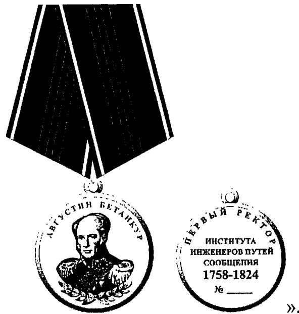
РИСУНОК медали Августина Бетанкура

25. Положение о медали «За безупречный труд и отличие» изложить в следующей редакции: