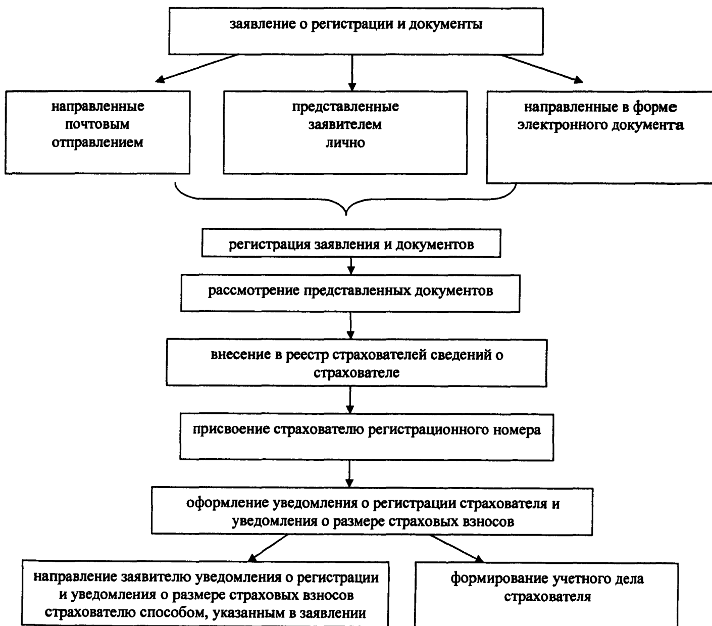
Блок-схема последовательности действий при регистрации в качестве страхователей