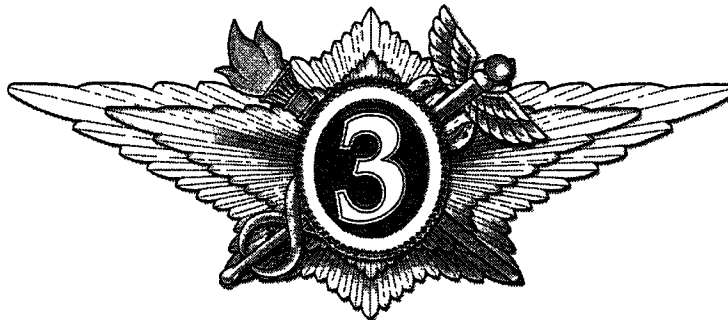
Рисунок нагрудного знака «Специалист третьего класса»