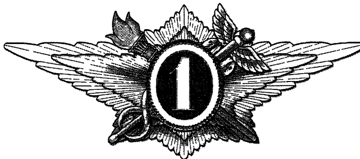
Рисунок нагрудного знака «Специалист первого класса»