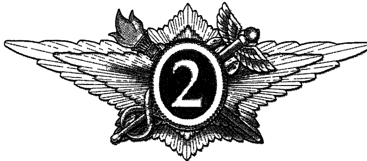
Рисунок нагрудного знака «Специалист второго класса»