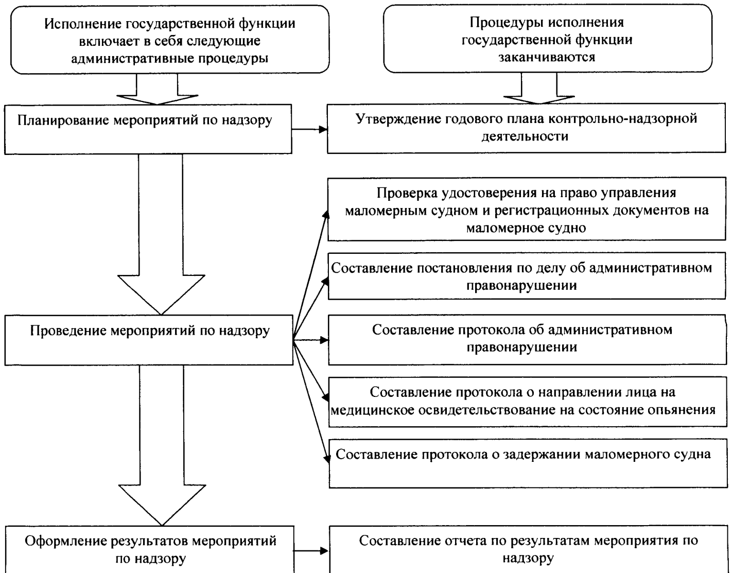
Блок-схема исполнения государственной функции по надзору за пользованием маломерными судами