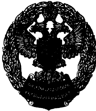
Рисунок нагрудного знака «Почетный работник Роспотребнадзора»