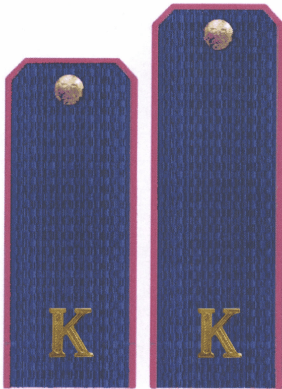
Эскиз № 3