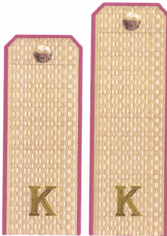
Эскиз № 1