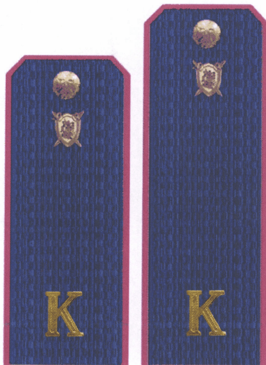
Эскиз № 4».