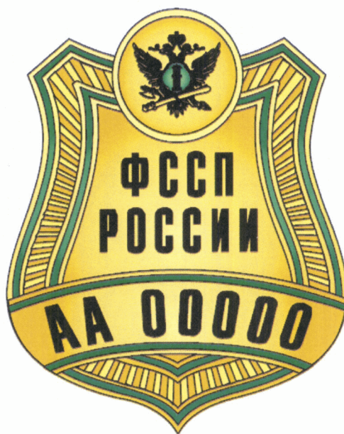
Рисунок нагрудного служебного знака судебного пристава

Приложение № 2 к приказу ФССП России от 10.01.2024 № 1