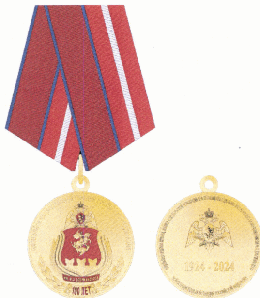
лицевая сторона оборотная сторона

официального геральдического знака – памятной медали Федеральной службы войск национальной гвардии Российской Федерации «100 лет со дня образования Отдельной орденов Жукова, Ленина и Октябрьской Революции Краснознаменной дивизии оперативного назначения имени Ф.Э. Дзержинского войск национальной гвардии Российской Федерации»