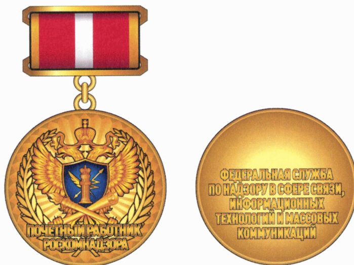
Рисунок нагрудного знака

Ширина ленты – 24 мм, ширина золотистой каймы – 2 мм.