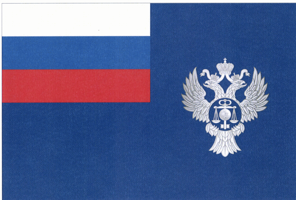
Рисунок флага Федерального казначейства

Приложение № 5 к приказу Министерства финансов Российской Федерации от 10.05.2023 г. № 66н