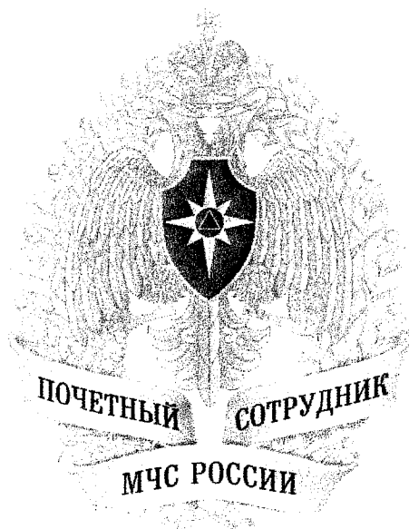
Рисунок нагрудного знака МЧС России «Почетный сотрудник МЧС России»