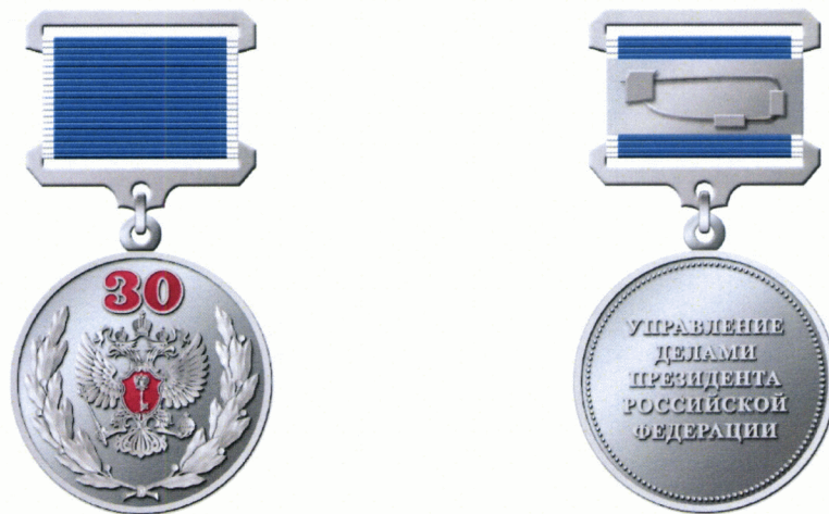
РИСУНОК памятной медали «30 лет Управлению делами Президента Российской Федерации»

к Положению о памятной медали «30 лет Управлению делами Президента Российской Федерации»