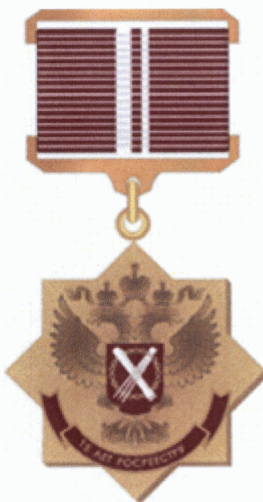
Рисунок нагрудного знака Федеральной службы государственной регистрации, кадастра и картографии «15 лет Росреестру»

Колодка на оборотной стороне имеет булавку для крепления нагрудного знака к одежде.