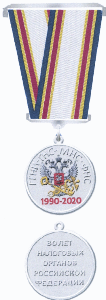
РИСУНОК памятной медали Федеральной налоговой службы «30 лет налоговых органов Российской Федерации»

Приложение № 2 к Положению о памятной медали Федеральной налоговой службы «30 лет налоговых органов Российской Федерации», утвержденному приказом ФНС России от «10» 02 2020 г. № Еб-4-4/86 @