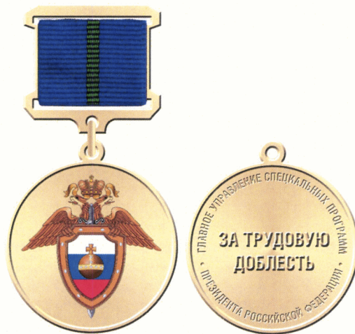
Рисунок медали «За трудовую доблесть»