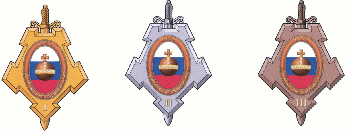
Рисунок нагрудного знака «За службу на спецобъектах»