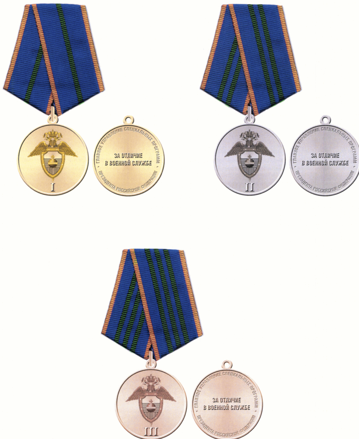
Рисунок медали «За отличие в военной службе»