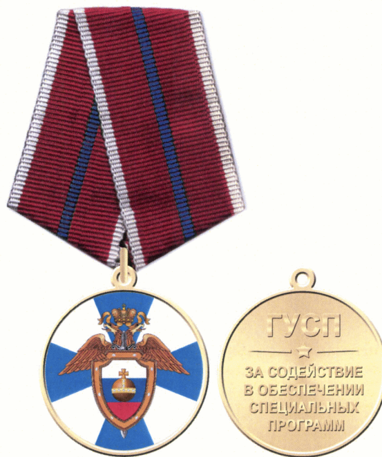
Рисунок медали «За содействие в обеспечении специальных программ»