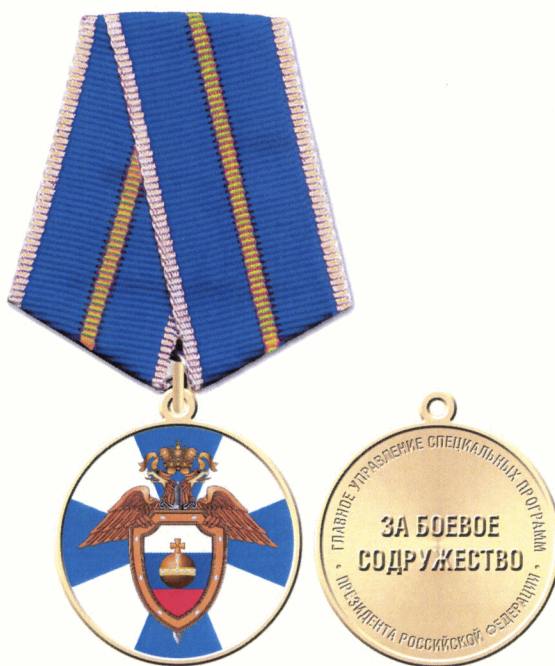
Рисунок медали «За боевое содружество»