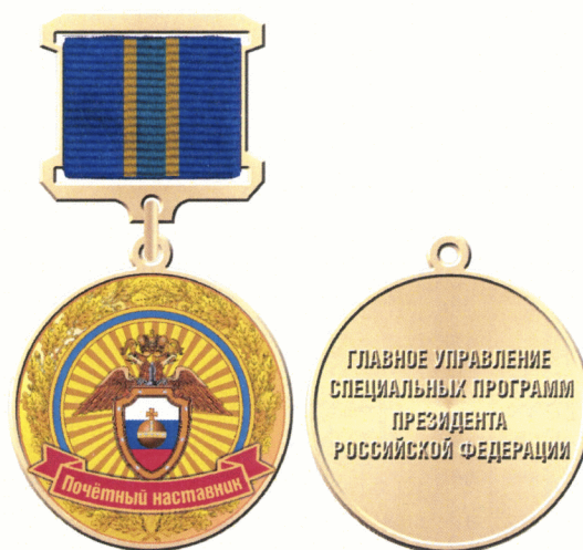
Рисунок нагрудного знака «Почетный наставник»