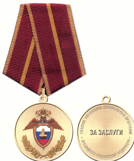
Рисунок медали «За заслуги»