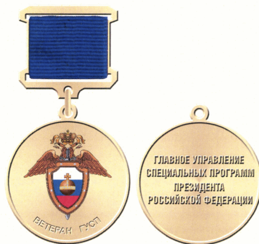
Рисунок медали «Ветеран Главного управления специальных программ Президента Российской Федерации»