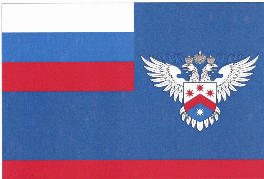
Рисунок флага Федеральной службы по интеллектуальной собственности

Приложение № 5 к приказу Минэкономразвития России от 04.12. 2019 г. № 784