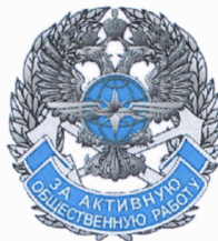
РИСУНОК знака «За активную общественную работу»

На оборотной стороне знака имеется приспособление для крепления к одежде.