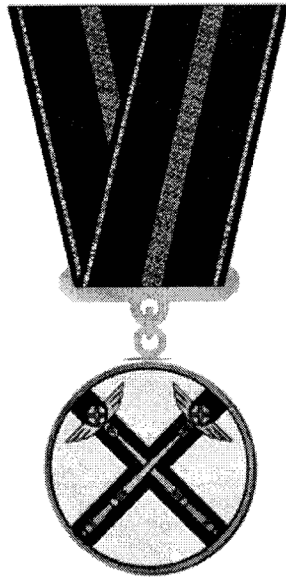
РИСУНОК Медали Федеральной антимонопольной службы «За защиту конкуренции»