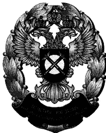
РИСУНОК нагрудного знака «Почетный работник антимонопольных органов России»

Нагрудный знак имеет миниатюрную копию. Размеры миниатюрной копии нагрудного знака: высота – 15 мм, ширина – 12 мм.