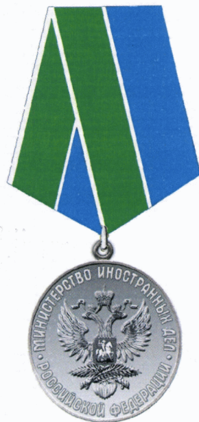
Рисунок нагрудной медали «За содействие в укреплении мира» Министерства иностранных дел Российской Федерации