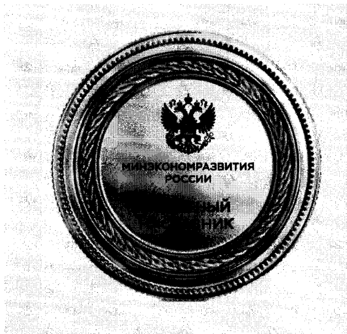
Рисунок ведомственного знака отличия Министерства экономического развития Российской Федерации «Почетный наставник Министерства экономического развития Российской Федерации»