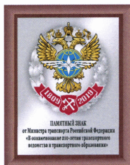
РИСУНОК памятного знака от Министра транспорта Российской Федерации «В ознаменование 210-летия транспортного ведомства и транспортного образования»