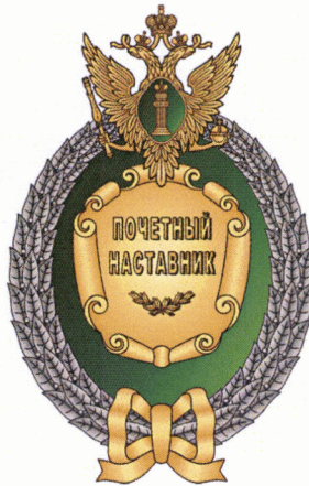
РИСУНОК ЗНАКА ОТЛИЧИЯ «ПОЧЕТНЫЙ НАСТАВНИК МИНИСТЕРСТВА ЮСТИЦИИ РОССИЙСКОЙ ФЕДЕРАЦИИ»