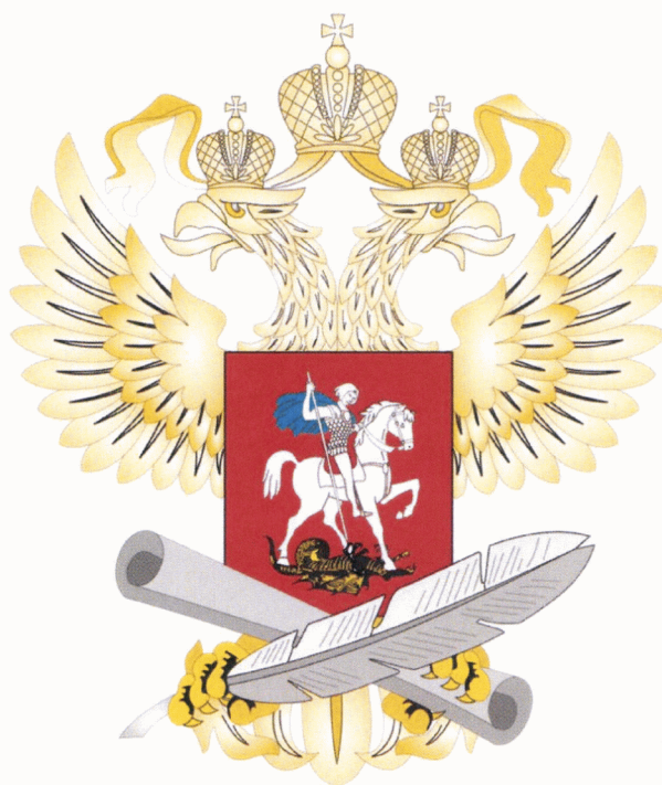
Рисунок геральдического знака – малой эмблемы Министерства просвещения Российской Федерации