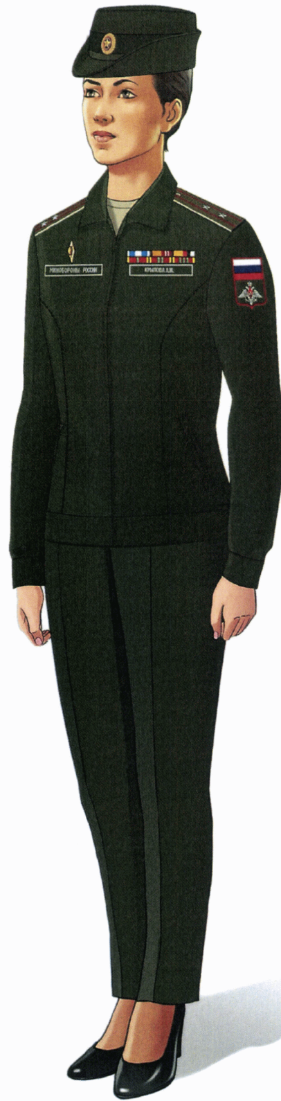
Рис. Летняя повседневная форма одежды гражданских служащих (кроме действительных государственных советников Российской Федерации и государственных советников Российской Федерации 1 класса)