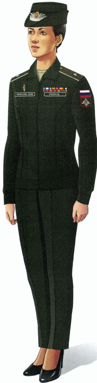
Рис. Летняя повседневная форма одежды действительных государственных советников Российской Федерации и государственных советников Российской Федерации 1 класса