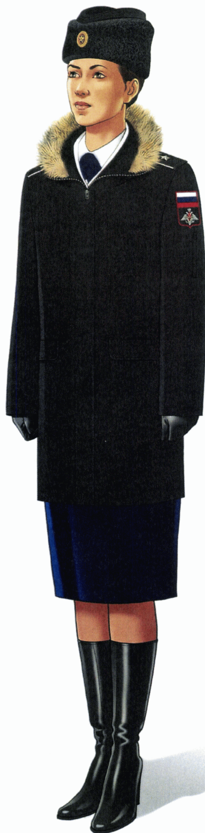
Рис. Зимняя парадная форма одежды действительных государственных советников Российской Федерации и государственных советников Российской Федерации 1 класса