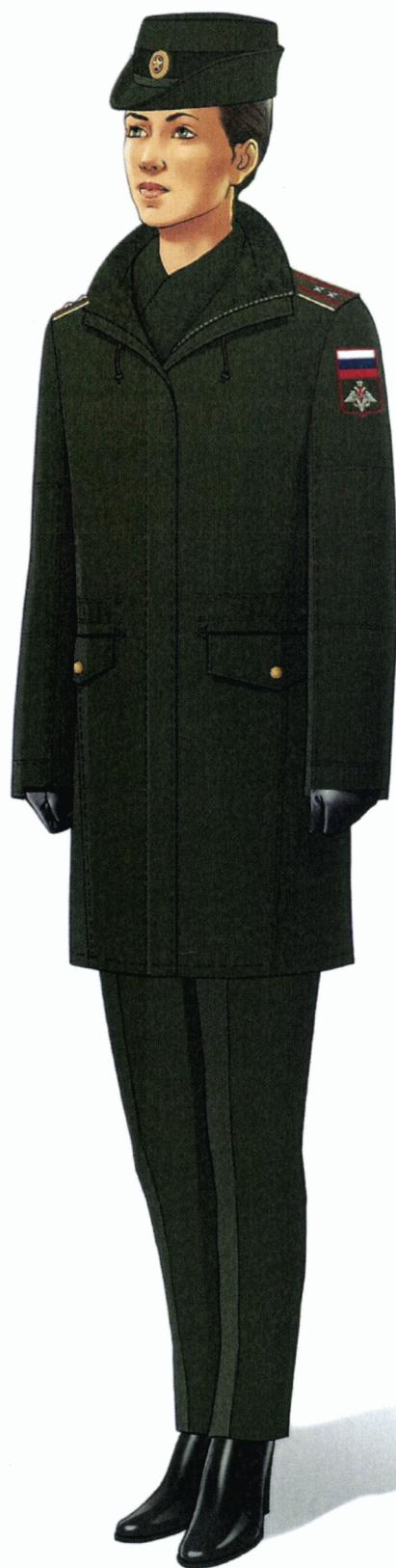
Рис. Зимняя повседневная форма одежды (в шляпе повседневной) гражданских служащих (кроме действительных государственных советников Российской Федерации и государственных советников Российской Федерации 1 класса)