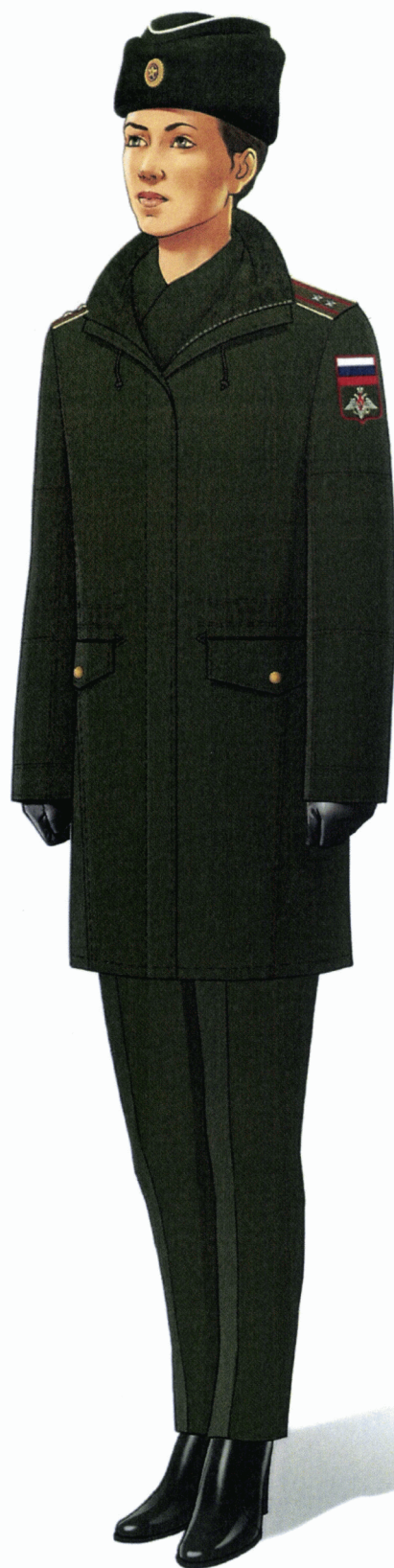
Рис. Зимняя повседневная форма одежды гражданских служащих (кроме действительных государственных советников Российской Федерации и государственных советников Российской Федерации 1 класса)