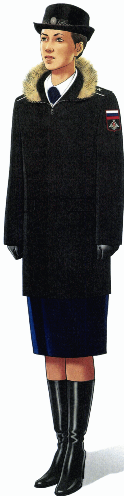
Рис. Зимняя парадная форма одежды (в шляпе парадной) действительных государственных советников Российской Федерации и государственных советников Российской Федерации 1 класса