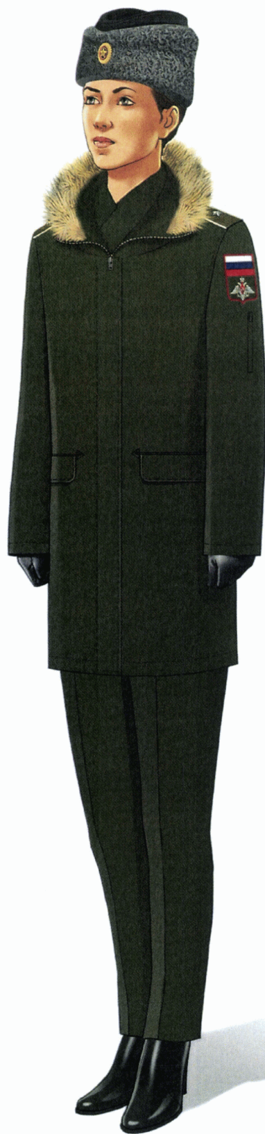
Рис. Зимняя повседневная форма одежды действительных государственных советников Российской Федерации и государственных советников Российской Федерации 1 класса