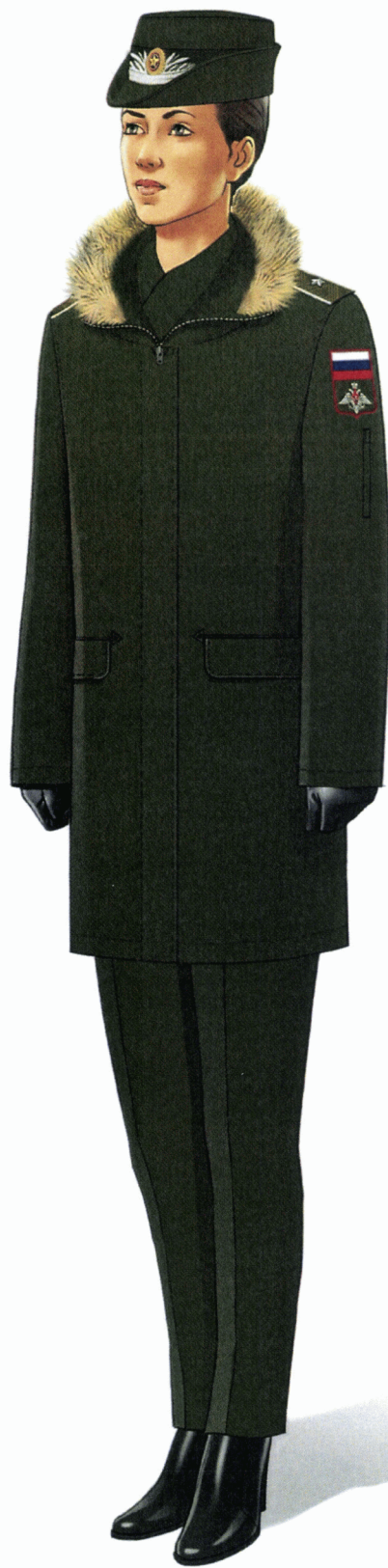
Рис. Зимняя повседневная форма одежды (в шляпе повседневной) действительных государственных советников Российской Федерации и государственных советников Российской Федерации 1 класса