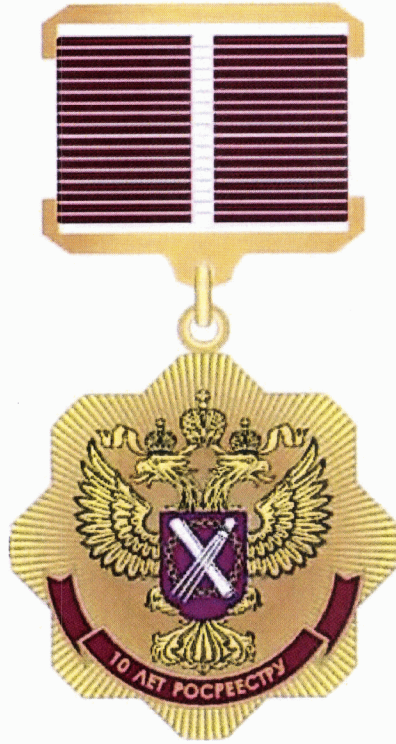
Рисунок нагрудного знака «10 лет Росреестру»