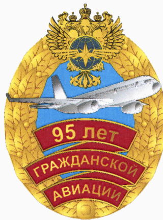
РИСУНОК памятного знака «95 лет гражданской авиации»

Памятный знак порядковый номер не имеет.