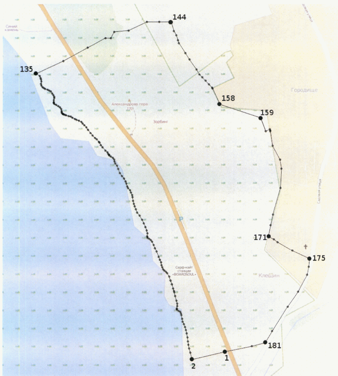
Схема границ территории объекта культурного наследия федерального значения – достопримечательное место «Клещин», нач. I тыс. до н. э. – нач. I тыс. н. э., X–XVII вв. н. э. (Ярославская область, Переславский район, с. Городище)