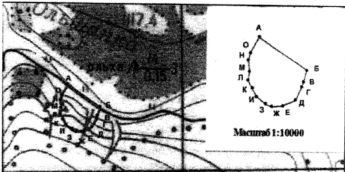
Схема границ территории объекта культурного наследия федерального значения «Петропавловка городище-1», VII – III вв. до н. э. (Белгородская область, Чернянский район, 0,5 км к юго-востоку от с. Петропавловка (ул. Дмитриевская, д. 5)

_____ – граница территории объекта культурного наследия «Петропавловка городище-1», VII–III вв. до н.э.