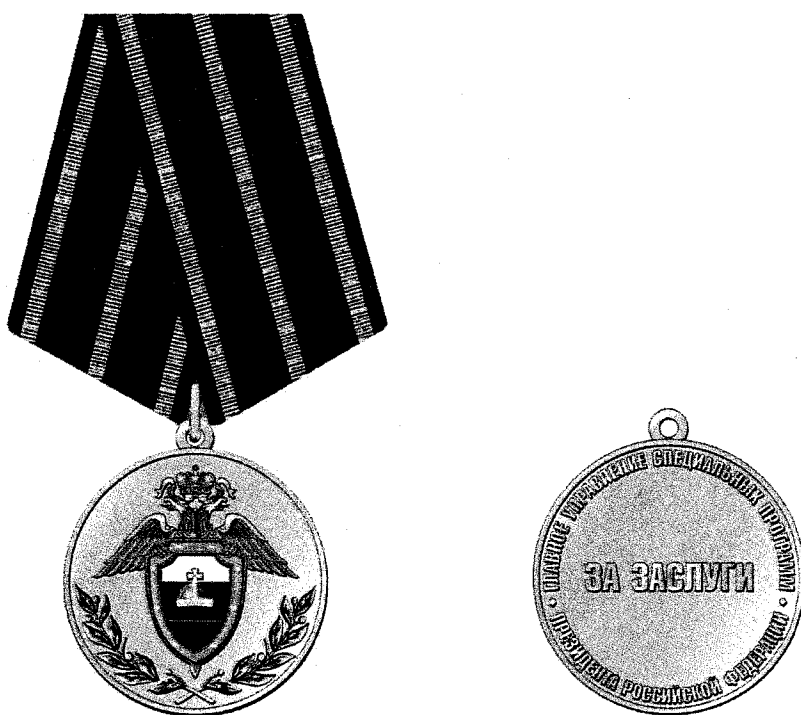
РИСУНОК медали «За заслуги»

Медаль при помощи ушка и кольца соединяется с пятиугольной колодкой, обтянутой шелковой муаровой лентой темно-красного цвета шириной 24 мм с желтыми полосами по краям. Посередине ленты желтая полоса шириной 2 мм.