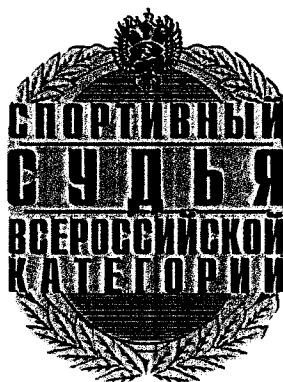
Рисунок нагрудного знака «спортивный судья всероссийской категории»

Описание нагрудного знака «спортивный судья всероссийской категории»