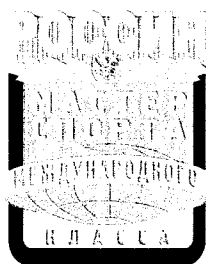
Рисунок нагрудного знака «мастер спорта России международного класса»