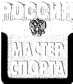
Рисунок нагрудного знака «мастер спорта России»