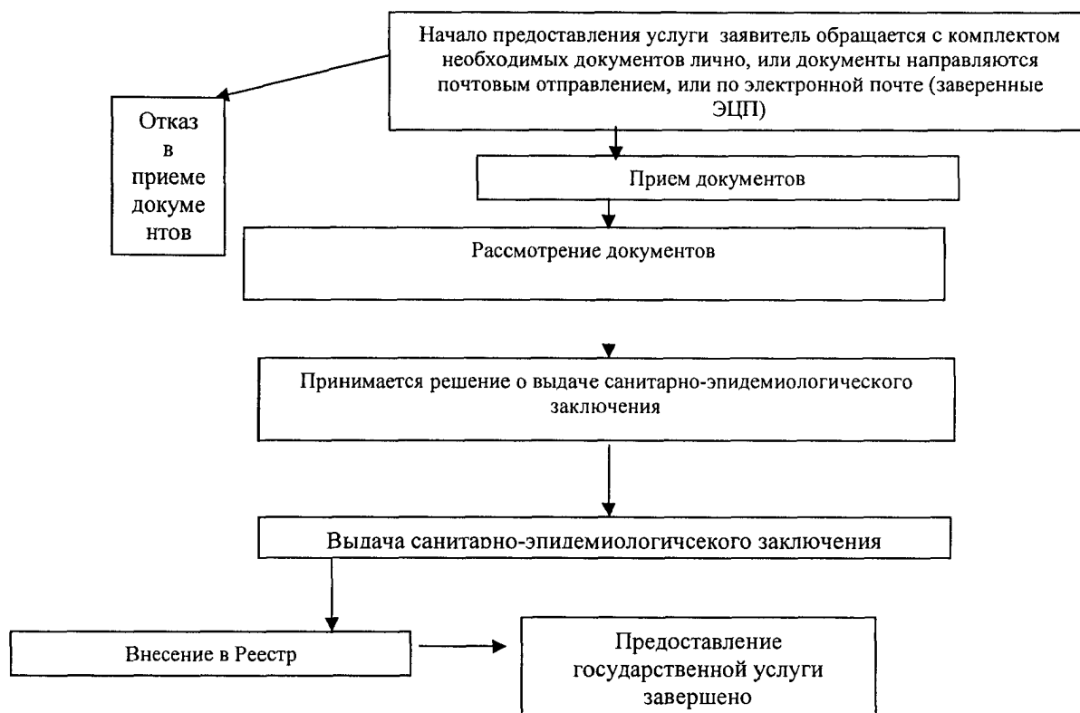
Блок-схема состава административных процедур по предоставлению государственной услуги