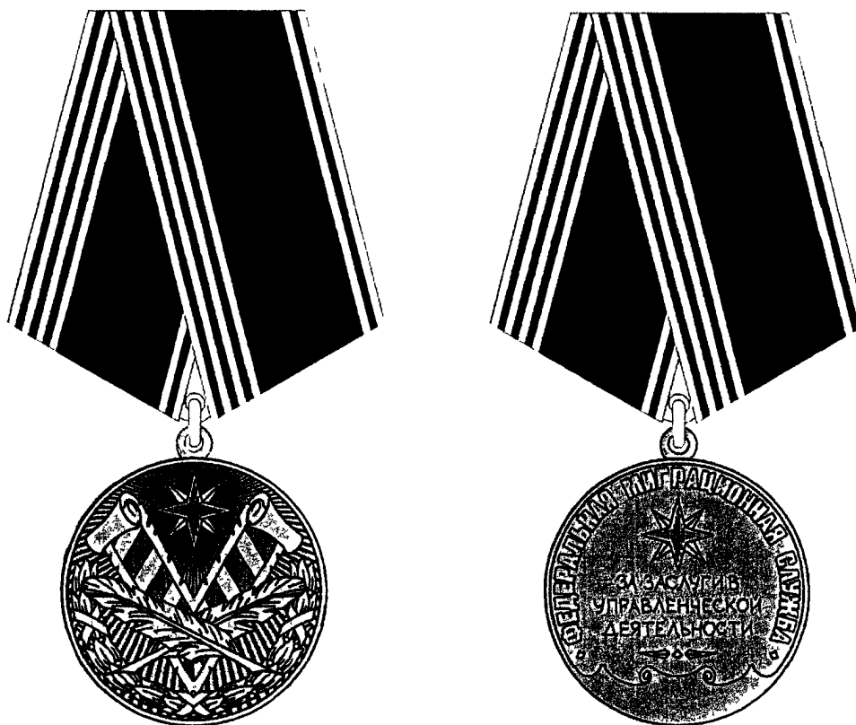
РИСУНОК медали Федеральной миграционной службы «За заслуги в управленческой деятельности» III степени

Приложение № 11 к приказу ФМС России от «25» октября 2011 г. № 460