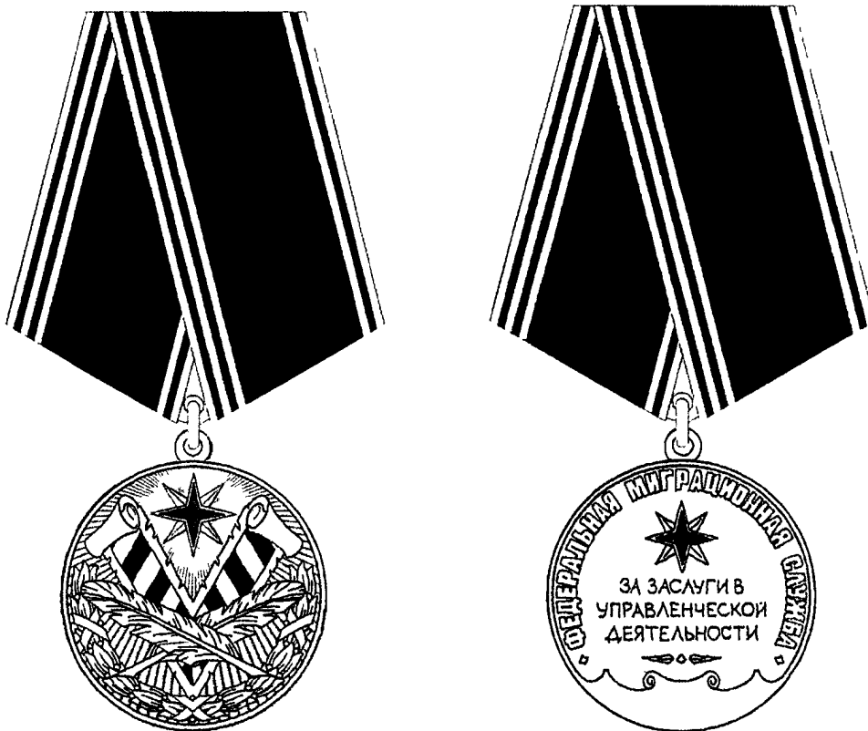
РИСУНОК медали Федеральной миграционной службы «За заслуги в управленческой деятельности» II степени

Приложение № 7 к приказу ФМС России от «25» октября 2011 г. № 468