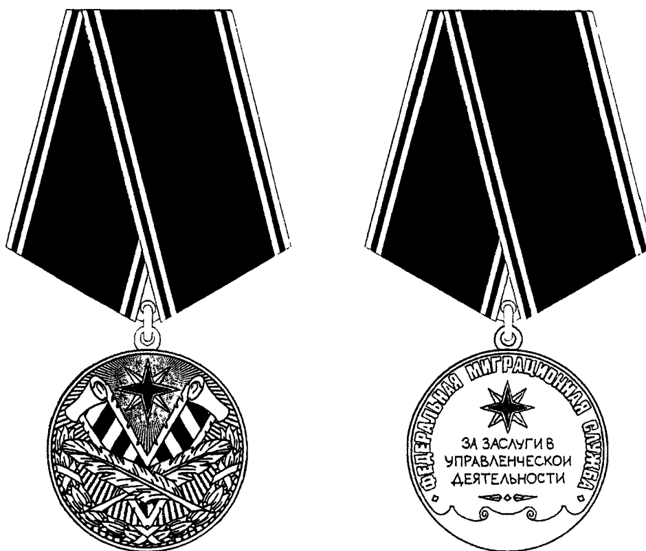
РИСУНОК медали Федеральной миграционной службы «За заслуги в управленческой деятельности» I степени

Приложение № 3 к приказу ФМС России от « 15 » октября 2011 г. № 480