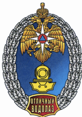
Рисунок нагрудного знака МЧС России «Отличный водолаз»