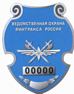
Рисунок. Жетон работника федерального государственного унитарного предприятия «Управление ведомственной охраны Министерства транспорта Российской Федерации»

В нижней части жетона располагается серебристая пятиугольная пластина, наложенная на лавровые листья серебристого цвета.