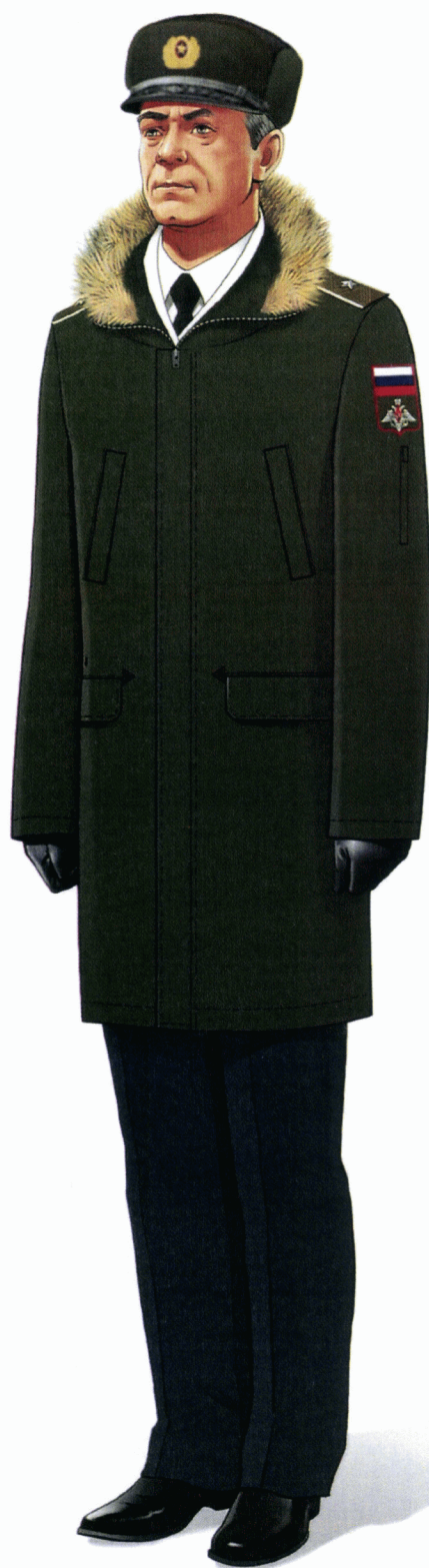
Рис. Зимняя парадная форма одежды действительных государственных советников Российской Федерации и государственных советников Российской Федерации 1 класса