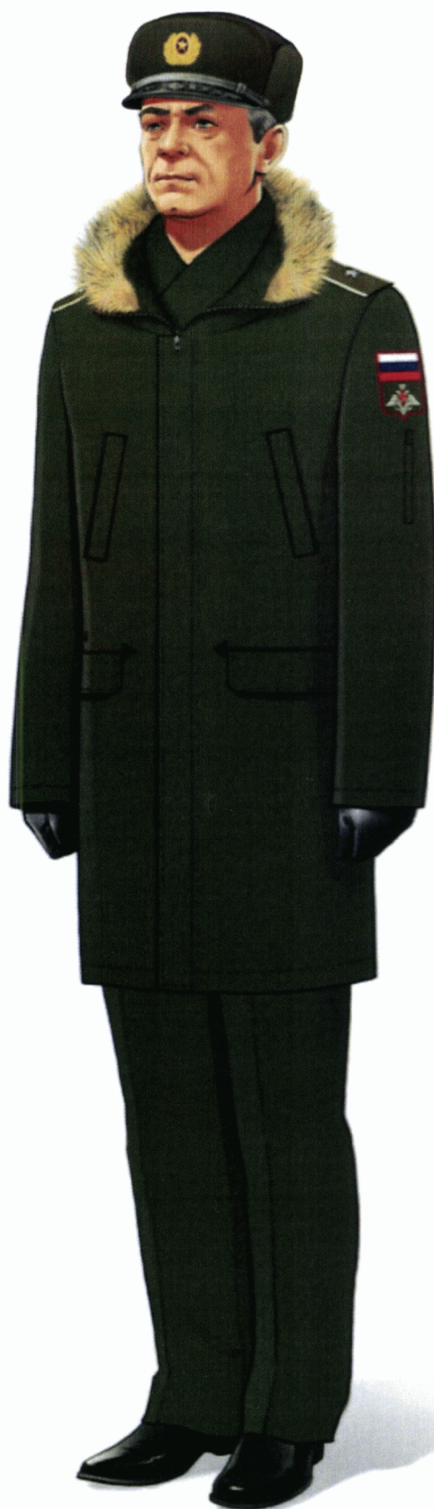
Рис. Зимняя повседневная форма одежды действительных государственных советников Российской Федерации и государственных советников Российской Федерации 1 класса