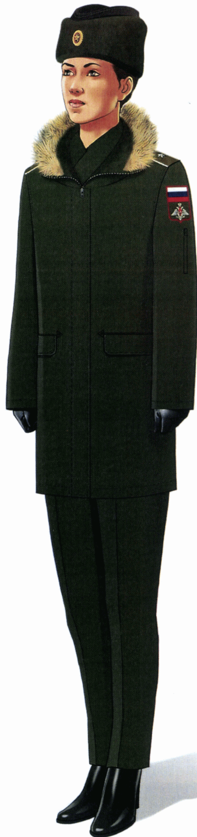
Рис. Зимняя повседневная форма одежды действительных государственных советников Российской Федерации и государственных советников Российской Федерации 1 класса»;