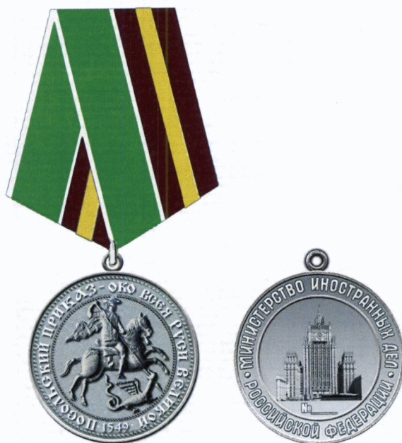
Рисунок нагрудной медали Министерства иностранных дел Российской Федерации «Посольский приказ»

Приложение № 2 к Положению о нагрудной медали Министерства иностранных дел Российской Федерации «Посольский приказ», утвержденному приказом МИД России от «31» мая 2021 г. № 9730