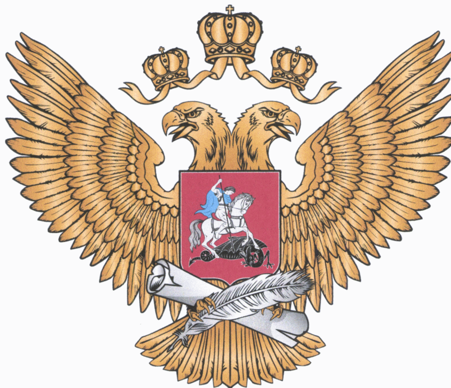
Рисунок геральдического знака – малой эмблемы Министерства просвещения Российской Федерации