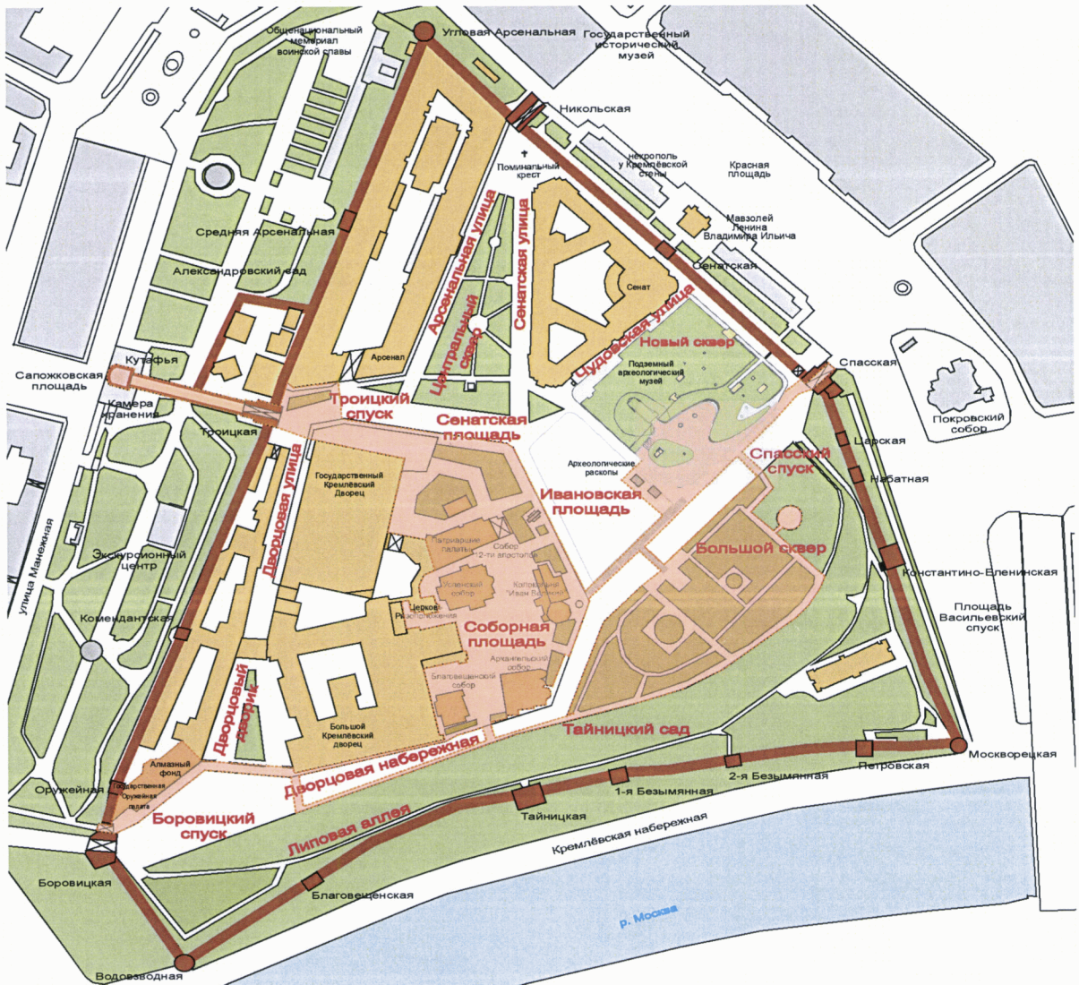
СХЕМА размещения объектов улично-дорожной сети, парково-садовых территорий и туристической зоны Московского Кремля

Тайницкий сад - название объектов улично-дорожной сети и парково-садовых территорий в Московском Кремле