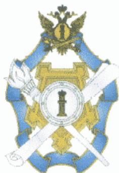
Рисунок нагрудного знака "Лучший работник учреждений и органов, исполняющих наказания, не связанные с изоляцией осужденных от общества"