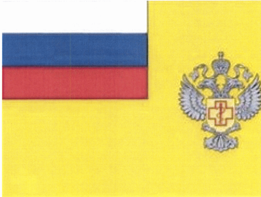
Рисунок вымпела Федеральной службы по надзору в сфере защиты прав потребителей и благополучия человека