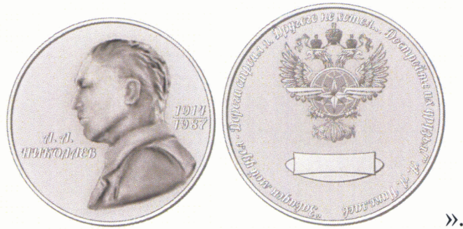
РИСУНОК медали А.А. Николаева

8. Приложения №№ 12 – 34 к приказу считать соответственно приложениями №№ 13 – 35 к приказу.