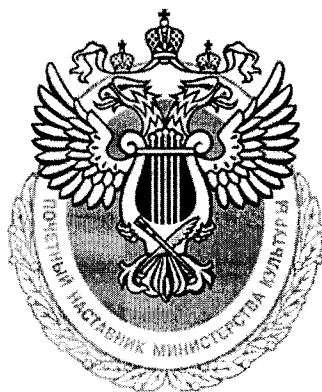
Рисунок ведомственного знака отличия Министерства культуры Российской Федерации «Почетный наставник»

Ведомственный знак отличия Министерства культуры Российской Федерации «Почетный наставник» представляет собой рельефное изображение геральдического знака – эмблемы Министерства культуры Российской Федерации: двуглавый орел с поднятыми распущенными крыльями, увенчанный двумя малыми коронами и над ними – одной большой короной, соединенными лентами. На груди орла – щит, края которого окаймляют серебряную лиру. На нижней части лиры – перекрещенные диагонально кисть и перо. По нижнему краю знака надпись: «ПОЧЕТНЫЙ НАСТАВНИК МИНИСТЕРСТВА КУЛЬТУРЫ».