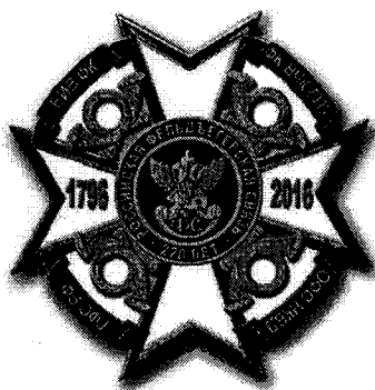
РИСУНОК ведомственного знака отличия – памятного знака Государственной фельдъегерской службы Российской Федерации «220 лет Российской фельдъегерской связи»

Приложение № 3 к приказу ГФС России от « 02 » августа 2016 г. № 241