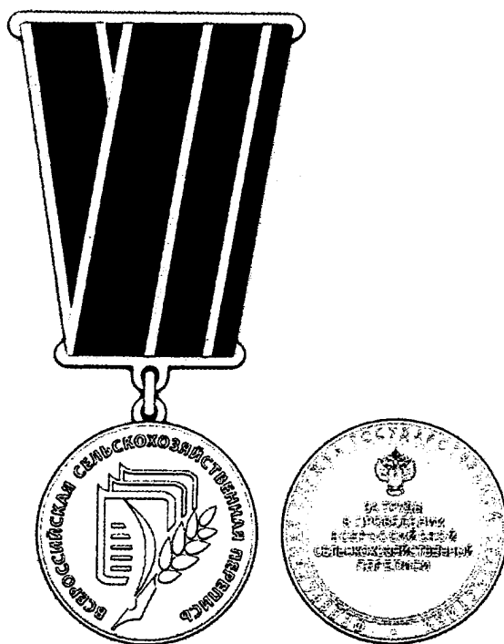
Рисунок медали «За труды в проведении Всероссийской сельскохозяйственной переписи» (лицевая и оборотная сторона)