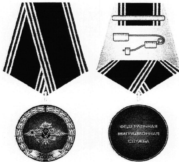
Рисунок памятной медали «ФМС России 25 лет»

Приложение № 3 к приказу ФМС России от « 15 » 02 2016 г. № 44