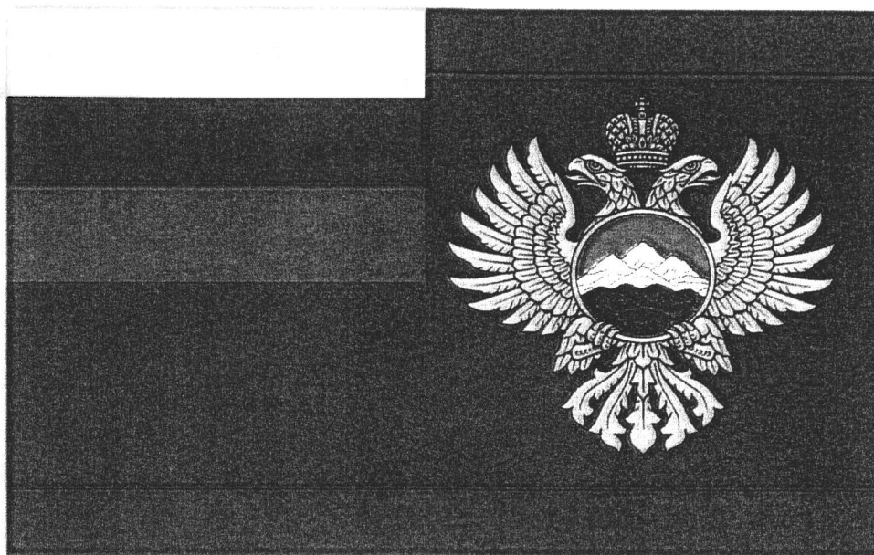
Рисунок флага Министерства Российской Федерации по делам Северного Кавказа

УТВЕРЖДЕН приказом Министерства Российской Федерации по делам Северного Кавказа от « 11 » МАЯ 2016 г. № 65